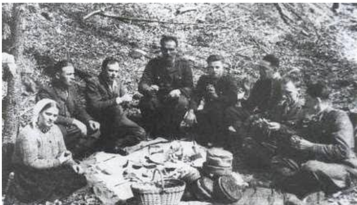
Фото 11. Повстанський Великдень (на думку Ю. Паєвського, 1949 р.).