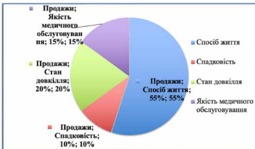
Рис. 2. Фактори, які впливають на здоров'я людини

Нижче у схемах наведено фактори, які впливають на здоров'я людини, а також складові ціннісного ставлення до здоров'я.