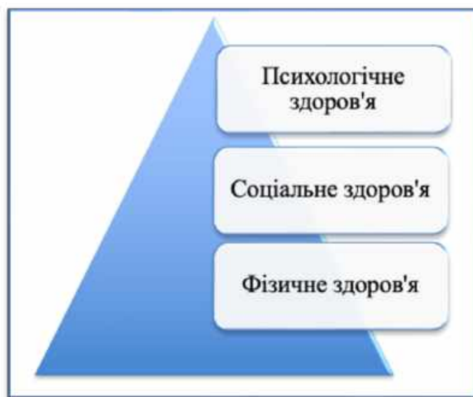
Рис. 1. Взаємозв'язок складових здоров'я

З точки зору медицини, існує фізичне, психологічне та соціальне здоров'я, як зазначено біопсихосоціальною моделлю за міжнародною класифікацією функціонування, обмеження життєдіяльності та здоров'я.