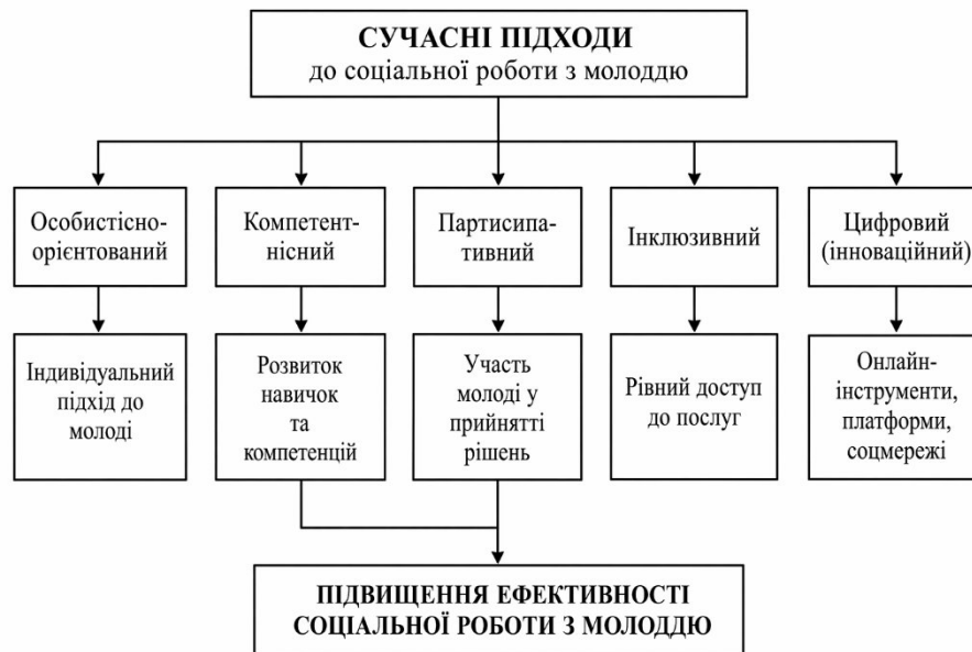
Рисунок 2. Схема – Сучасні підходи до організації соціальної роботи з молоддю

Подана схема відображає взаємозв'язок основних сучасних підходів до організації соціально-педагогічної роботи з молоддю. У центрі знаходиться інтеграція різних підходів, кожен з яких виконує окрему функцію: особистісно орієнтований підхід забезпечує індивідуалізацію роботи, компетентнісний – розвиток необхідних навичок, партисипативний – залучення молоді до прийняття рішень, інклюзивний – гарантує рівність доступу, а цифровий – розширює можливості комунікації та надання послуг. Сукупність цих підходів формує комплексну модель соціально-педагогічної роботи, спрямовану на підвищення її ефективності та адаптивності до сучасних умов (див. Рис. 2).