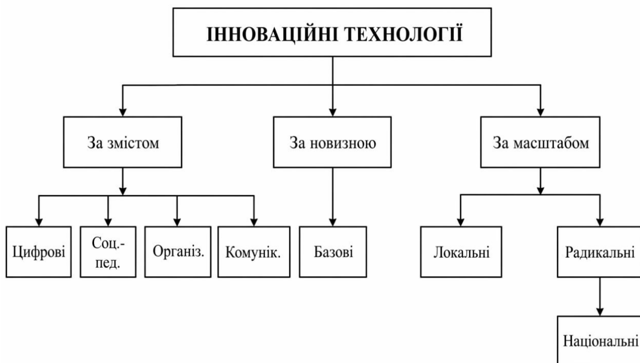
Рисунок.2.1.Схема – Структура класифікації інноваційних технологій у соціальній роботі з молоддю

Для кращого розуміння взаємозв'язку між різними видами інноваційних технологій доцільно представити їх у вигляді схеми.