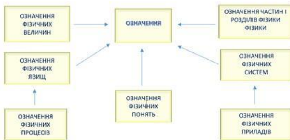
Мал.1: Блок-схема взаємозв'язків між різними типами означень у фізиці.

Розглянемо Блок-схему взаємозв'язків фізичних означень: